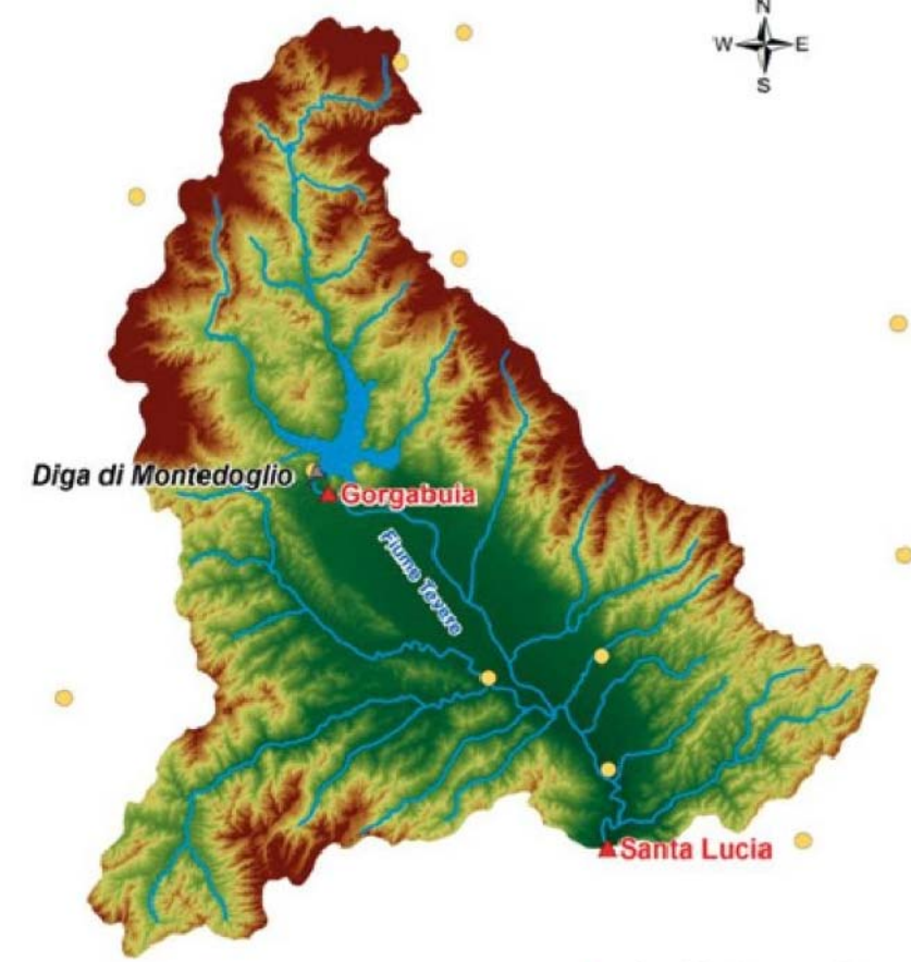
AREA ALLA SEZIONE DI SANTA LUCIA: 934 km 2